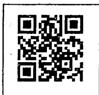
สิ่งที่ส่งมาด้วย ๑