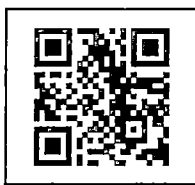
สิ่งที่ส่งมาด้วย ๒